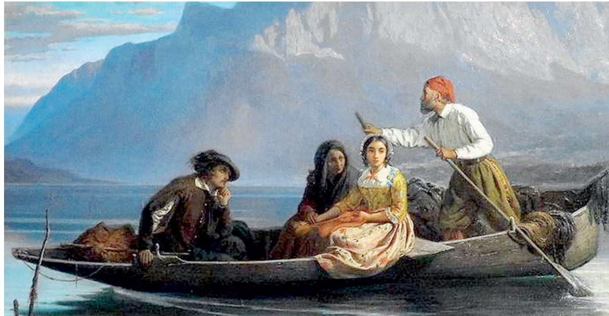
I Promessi Sposi Un famoso quadro che ritrae l'addio di Lucia al paese tanto amato, ai monti e alla sua casa.