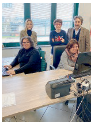
PB SERVIZI Il team della società.

conservare, il proprio archivio: la digitalizzazione documentale. Un'operazione che va di pari passo con l'ampliamento del bacino di clientela e che guarda sempre più anche ai liberi professionisti. «La pandemia ha schiacciato l'acceleratore su una ormai inderogabile svolta in chiave digitale. Basti pensare allo smart working: avere la possibilità di avere sul proprio pc