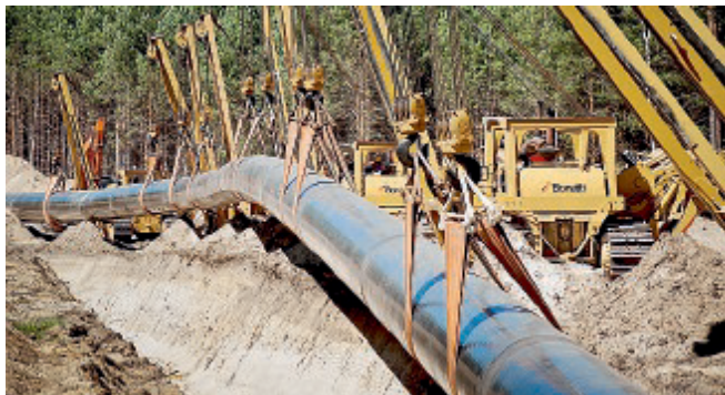
PIPELINE Un cantiere della Bonatti.

■ Bonatti, attraverso la controllata canadese Pacific Atlantic Pipeline Construction, ha ricevuto da TransCanada la conferma ad eseguire i lavori di costruzione del gasdotto «Coastal GasLink». L'ok al progetto giunge in seguito alla decisione dei soci della joint venture Lng Canada di procedere con la realizzazione dell'impianto di liquefazione gas previsto pres-