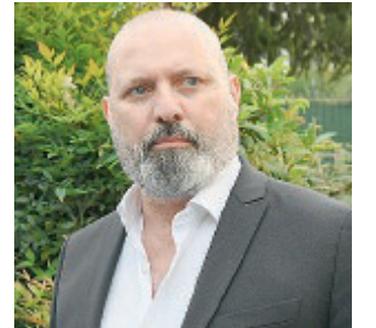
BONACCINI Lunedì sarà a Parma.