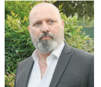
BONACCINI Lunedì sarà a Parma.