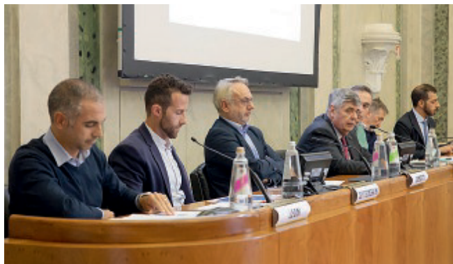
PALAZZO SORAGNA Un momento dell'incontro.

parte delle autorità competenti. Con le novità introdotte alla normativa già esistente - illustrate a Palazzo Soragna, in un incontro organizzato dall'Unione Parmense degli Industriali in collaborazione con Studio Alfa - l'iter che riguarda la Via (Valutazione di Impatto Ambientale) è diventato più snello.