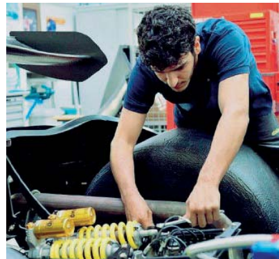
Nel segno dell'innovazione Al via corso biennale Its Maker.

La riuscita del progetto formativo, che nei mesi scorsi ha «sfornato» 11 primi ventiquattro diplomati, la maggior parte dei quali già occupati, è frutto di una grande collaborazione territoriale tra la Fondazione Its Maker, le istituzioni locali, la Regione Emilia Romagna, le aziende Berseffa, Dallara, Ducati, Ferrari, Turbo coating, BeamIT, Camattini, Elantasi, le università di Parma, Modena e Reggio Emilia e gli istituti scolastici «Gadda», «Berenini», «Da Vinci», «Zappa-Fermi» e