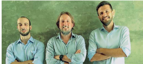
Team vincenti In alto gli ideatori del progetto Golgi, sotto i promotori del progetto Mach3D.

che hanno importato in Italia il concetto del fare start-up.