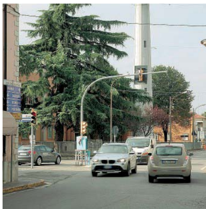
Basilicanova L'incrocio è stato più volte teatro di incidenti.

L'ultimo progetto presentato mantiene alcuni degli accorgimenti già anticipati in passato, ma arricchendosi di un dettaglio fondamentale: lo spostamento di un tratto di via Ghiare per dedicare uno spazio all'esclusivo passaggio ciclopeditone. Nello specifico, arrivando da Parma lungo via Argini Nord, per imboccare via Ghiare si farà una manovra che già normalmente le auto fanno anche se in realtà non potrebbero: si costeggerà la scuola attraversandone il parcheggio. In questo modo il primissimo tratto della stessa via Ghiare diventerà ad esclusivo uso ciclopeditone, anche in questo caso per codificare un uso già in voga, ovvero che i ciclisti percorrano la strada contromano.