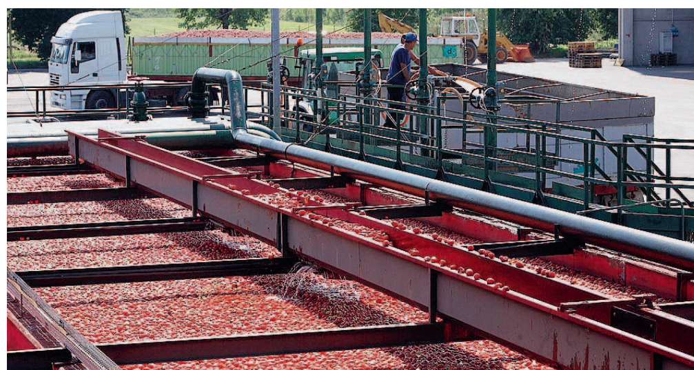
Disaccoppiamento Sull'anticipo al 2010 Asiipo e Anicav ribadiscono il proprio «no».