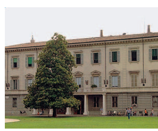
Provincia Ha istituito il tavolo.

Sigla l'intesa per la gestione della crisi dell'azienda Cofarpa di Fontanellato. Grazie all'adozione del contratto di solidarietà da parte di tutto il personale non dirigenziale (92 persone), verrà ridotto il numero degli esuberanti previsti (dai 40 iniziali si è passati a 16, di cui 13 sul nostro territorio). La firma è avvenuta ieri mattina nella sede di Concoop.