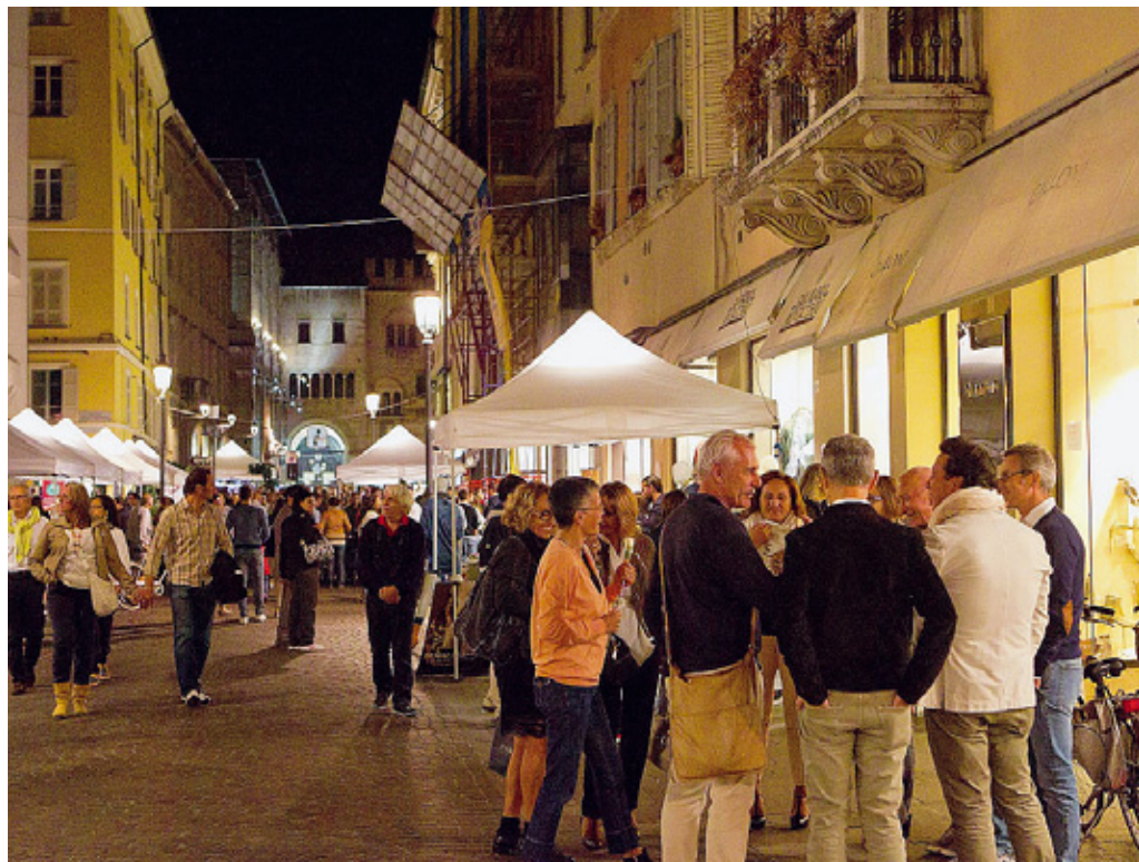
Negozi aperti dalle 10 a mezzanotte Centro preso d'assalto per il Fashion Day»: shopping anche di notte.