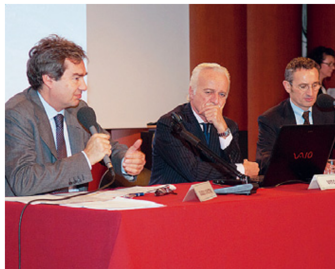
Casa della Musica Un momento dell'incontro.

La prima è l'elevata formazione, assicurata dalle 900 ore di lezioni in aula; la seconda è data invece da una sorta di corsia preferenziale per l'accesso al mondo del lavoro, che trova espressione nella possibilità di stage semestrali all'interno delle circa 70 aziende, nazionali ed estere, partner dell'iniziativa. Ne sanno qualcosa i 29 giovani allievi che hanno preso parte alla dodicesima edizione del Master, appen-