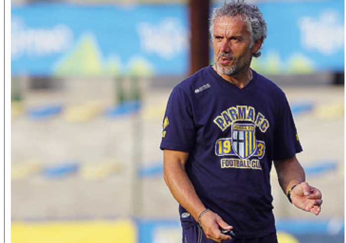
Mister Roberto Donadoni intervverrà a Palazzo Soragna.