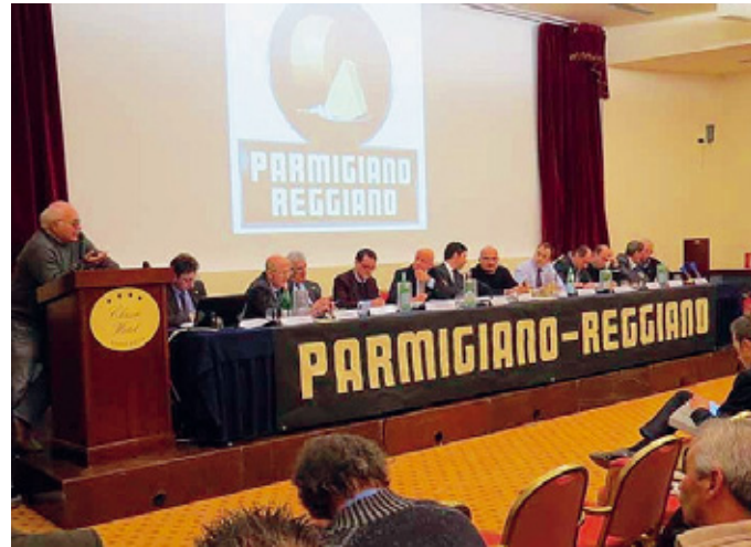
Parmigiano Reggiano. L'assemblea dei consorziati.

Una presa di posizione ferma, quella di Alai, con un rilancio dei piani produttivi e del loro valore strategico che prescinde dalla situazione congiunturale, che dovrebbe determinare, come si è detto, un leggero calo della produzione disponibile nel 2013 rispetto al 2012. Nonostante una produzione che a fine anno si attesterà a 3.330.000 forme (99 mila in più rispetto a quelle del 2011), il ter-